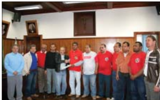
Um grupo de sindicalistas protocolaram um Moção de Repúdio contra a Emenda 3 na Câmara Municipal de Itu

do nosso Sindicato. “Nossa campanha contra a flexibilização dos direitos trabalhistas está a todo vapor, não vamos mais aceitar os desmandos dos patrões, ou eles respeitem o trabalhador ou as paralisações vão começar”, concluiu Marcos.