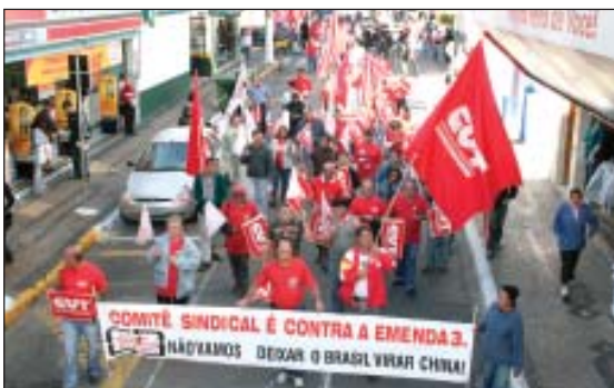
Cerca de 180 sindicalistas participaram da manifestação contra a Emenda 3 em Itu.

Depois da manifestação contra a precarização do trabalho e a Emenda 3, realizada pelo Comitê Sindical nas ruas de Salto, no final de maio, chegou a vez de Itu.