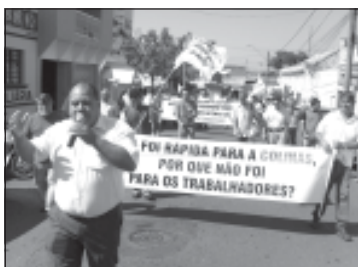
Manifestação de Sindicatistas e ex-trabalhadores da Marsicano realizada no mês de agosto

Desde o dia 20 de agosto do ano passado 240 ex-trabalhadores da Marsicano, que foi leiloada por 10 milhões para o Grupo Kia Motors de Itu, aguardam a liberação dos seus verbas rescisórias.