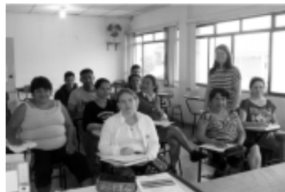
No último dia 22 de julho a parceria entre Sindicato dos Metalúrgicos de Salto e SESI -