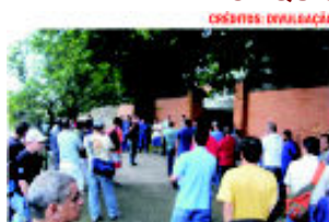
Trabalhadores da Recrusul em 2006 e durante assembleia recente em 2010

Os trabalhadores da Recrusul, localizada em São Leopoldo/RS, tiveram uma conquista histórica. Ao permanecerem vinculados à empresa no período de recuperação judicial, eles começaram a receber os salários relativos à de 2006, ano o qual a empresa esteve com a sua produção paralisada.