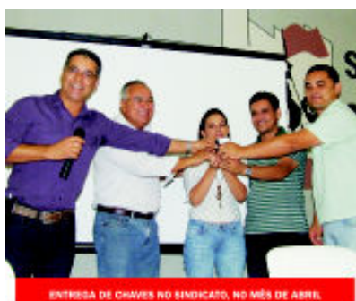
ENTREGA DE CHAVES NO SINDICATO, NO MÊS DE ABRIL.

O Governo construirá, a partir de 2011, mais 2 milhões de moradias na segunda fase do Programa Minha Casa Minha Vida.