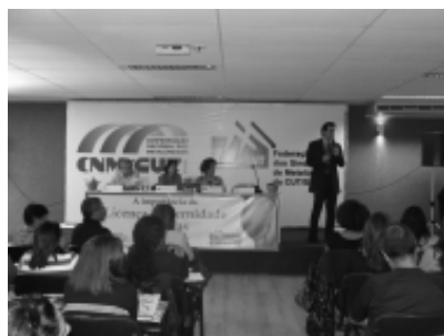
DIRETORES DO SINDICATO PARTICIPAM DO EVENTO E EXPÕEM SUAS DÚVIDAS

Segundo o Ministro da previdência Carlos Gabas, até agosto os aposentados vão receber os benefícios já reajustados. "Em relação ao que ficou para trás desde janeiro, ele disse que ainda precisa negociar com a equipe econômica para saber se essa diferença pode ser paga de uma só vez ou em parcelas".